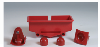
KIT MANDARINA / TANGERINE KIT (*)

- Entire juicer cabinet made of stainless steel