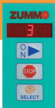
PROGRAMADOR Y CONTADOR DIGITAL PROGRAMMER AND DIGITAL COUNTER