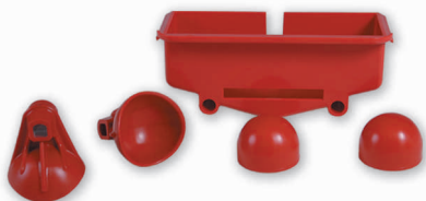
KIT COPAS GRANDES KIT LARGE CUPS